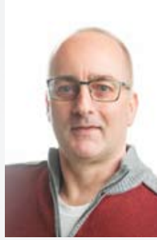
Hartmut Eilers Platz 16

Mit folgenden Themenschwerpunkten wollen wir uns für Lübberstedt einsetzen: