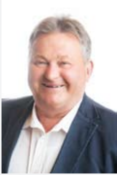
Jürgen Mehrstens Platz 5